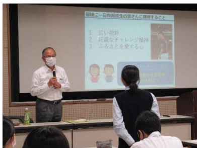
講演後は、私たちの質問に対して、気さくに答えてくださいました。日向市を愛し、日向市の発展や日向市民の幸福を願って市政に取り組まれていることを知り、私たちも高校生として日向市の発展に貢献したいという気持ちが高まりました。